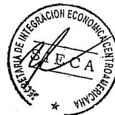
Orlando Solórzano Delgadillo Ministro de Fomento, Industria y Comercio de Nicaragua