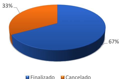
Grafico No 3. Líneas en estado final del Plan de Compras 2024