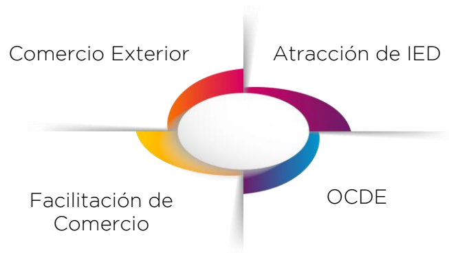
Ilustración 1: Ejes estratégicos de COMEX