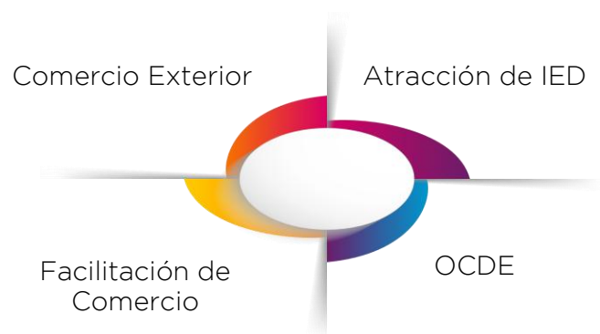
Ilustración 1: Ejes estratégicos de COMEX