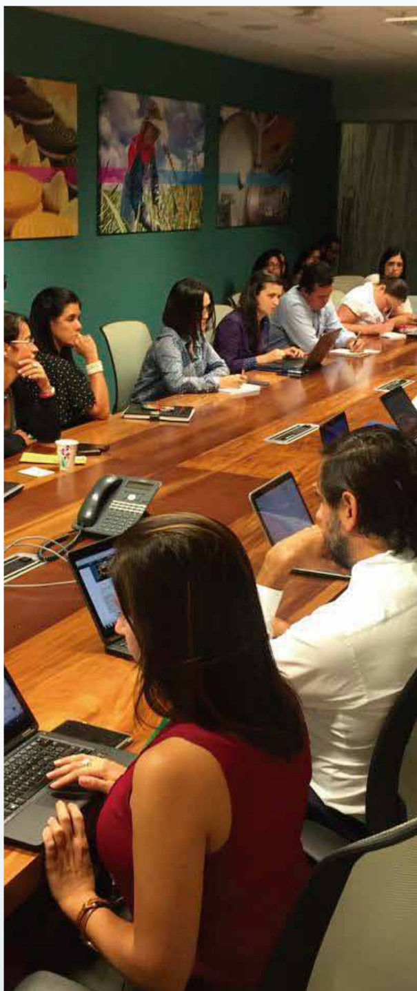
Consultas y procesos de información. Fuente: archivo COMEX