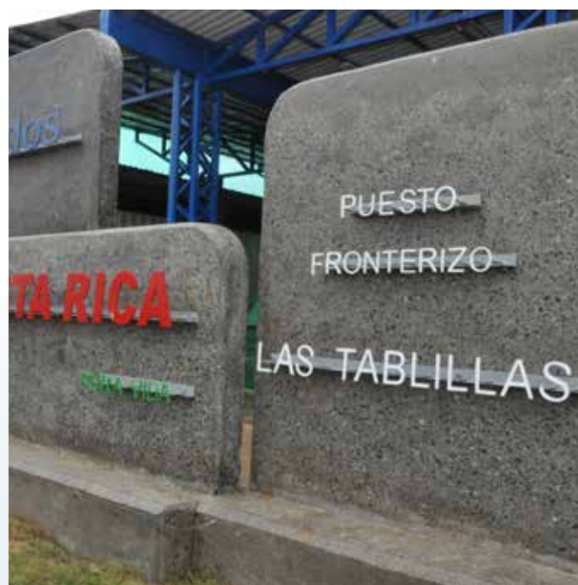
Puesto fronterizo provisional Las Tablillas.