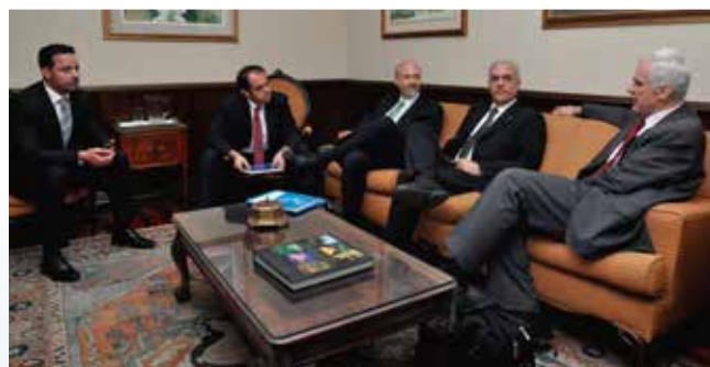
Reunión del Gobierno con personeros de OCDE.